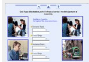
Un esempio di Esercizio