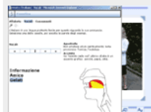
Un esempio tratto dalla Fonetica