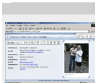
Una Spiegazione in stile "Human Touch"