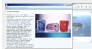
Un esempio di Approfondimento