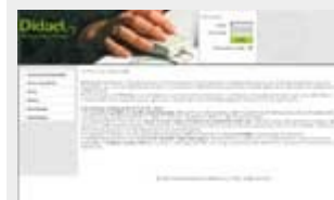
L'ambiente di e-Learning Dentro l'Italiano WLE